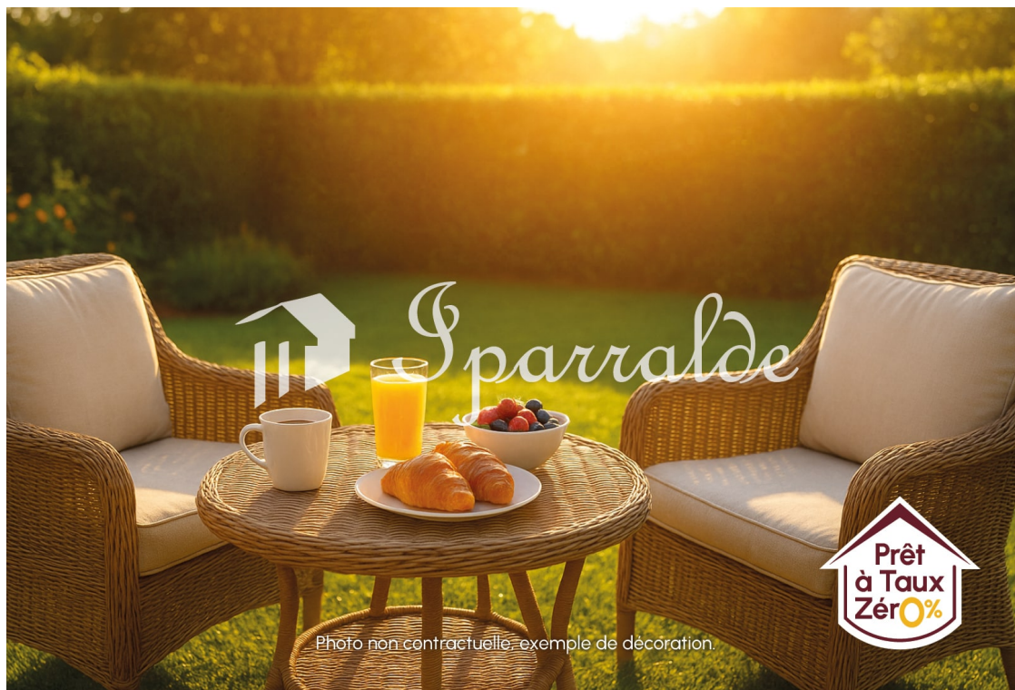
Photo non contractuelle, exemple de décoration.

¿Te gustaría disfrutar de tu propio Jardín Privado? ¡Descubre tu nuevo hogar en Hendaia - Playa! Este espectacular piso de 3 habitaciones y 2 baños es la opción perfecta para quienes buscan comodidad y calidad de vida. Con una bonita Terraza de 16,20m² + un jardín privado de 106,41 m², disfrutarás de un espacio exterior ideal para comidas al aire libre, momentos de relax, juegos infantiles y reuniones con amigos y familiares. La vivienda cuenta con mucho sol y luminosidad gracias a su triple orientación (Sur, Oeste y Este).